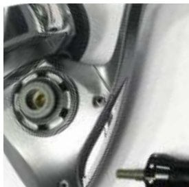
Manivela e roda de coroa com rosca

P/W. 728gr L/C. deep spool mm/Mt: 0.35/500 - 0.40/400 - D/P. 30Kg SALINUS LOW - R. : 4.1:1 SALINUS HIGH - R. : 5.2:1