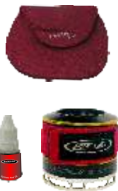
Kit de bolsa de transporte e braçadeira em neoprene mais óleo para lubrificação incluídos