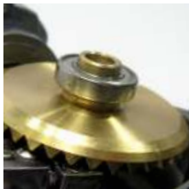
Roda de coroa em bronze